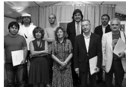
Acto de entrega de los premios del año pasado.