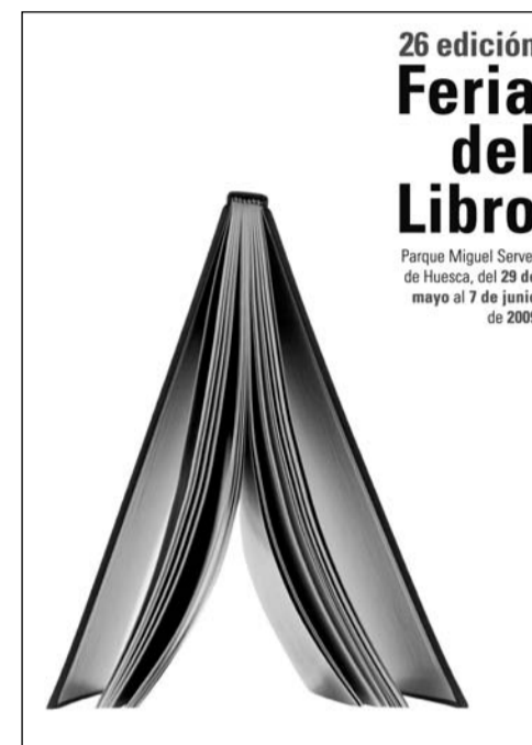
Cartel de la Feria de Huesca, realizado por Jesús Torralba

llegan, junto a noticias relacionadas con el sector, a varios miles de personas que ya se han dado de alta en el servicio gratuito del boletín electrónico. Una página desde la que se podrá acceder a las webs de las ferias de Huesca y Zaragoza. Las nuevas tecnologías se ponen al servicio del libro en un época en la que se ha abierto