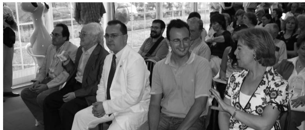
Acto de entrega de los premios de hace dos años.

Por último, el premio al Libro mejor editado ha recaído este año 2008 a Los años convulsos. El fotógrafo Alfonso y la Sublevación de Jaca (1923-1936) , Pirineum