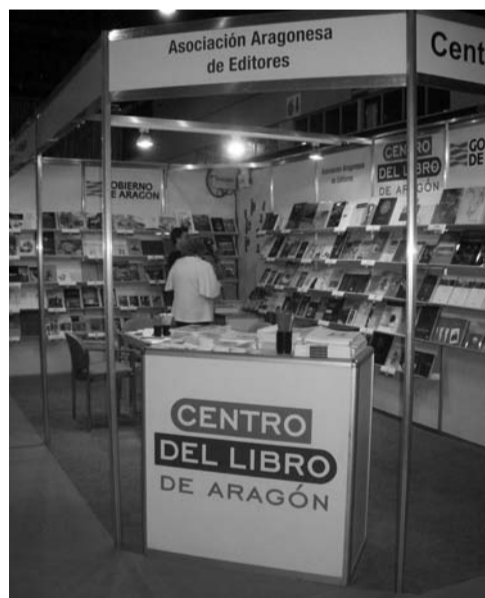
Stand del Centro del Libro de Aragón (Gobierno de Aragón) en Buenos Aires, 2009.