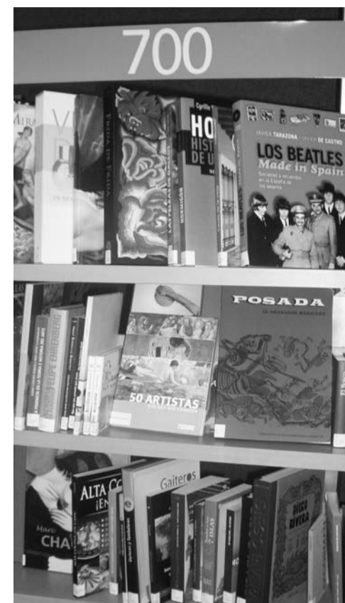
Imagen de uno de los anaqueles del Salón del Libro de la FIL de Guadalajara. Año 2008.

Se trata de un espacio de promoción adicional que ofrece la FIL de Guadalajara. En 2008 ofreció cinco mil títulos seleccionados por bibliotecarios mexicanos pertenecientes a la Coordinación de Bibliotecas de la Universidad de Guadalajara (UdeG), la Dirección General de Bibliotecas de la UNAM, la Asociación Mexicana de Bibliotecarios