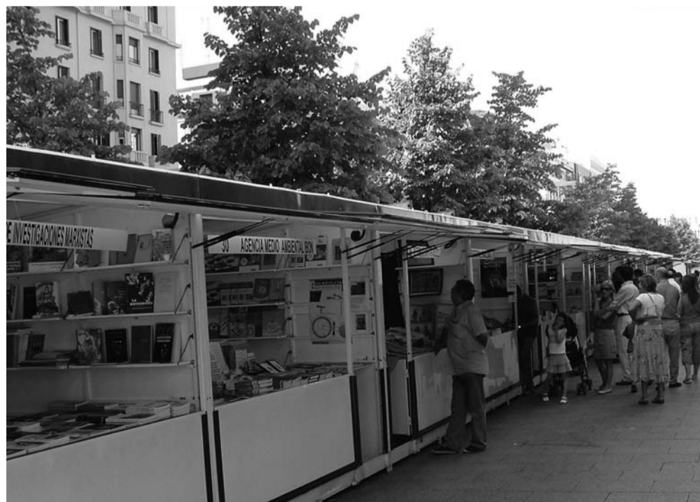
Casetas de la Feria del Libro de Zaragoza, situadas en el Paseo de la Independencia de Zaragoza. 2008.