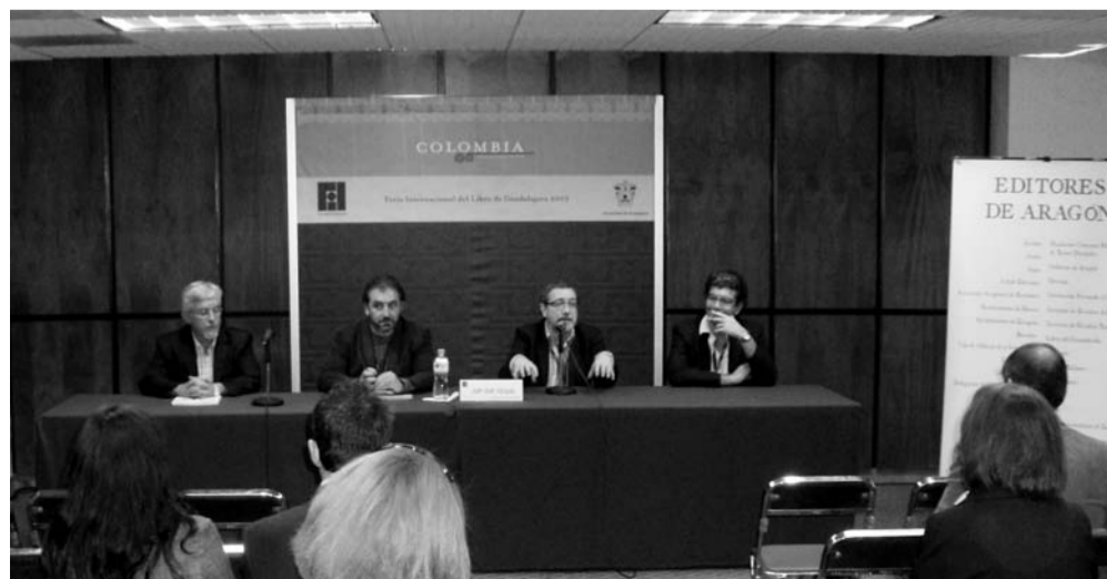
Acto de presentación del sector del libro de Aragón en la FIL de Guadalajara, 2008.