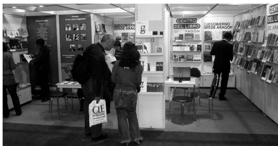
Stand del Gobierno de Aragón (Centro del Libro de Aragón) en la Feria Internacional del Libro de Frankfurt (Frankfurt Book Fair) en el año 2008.