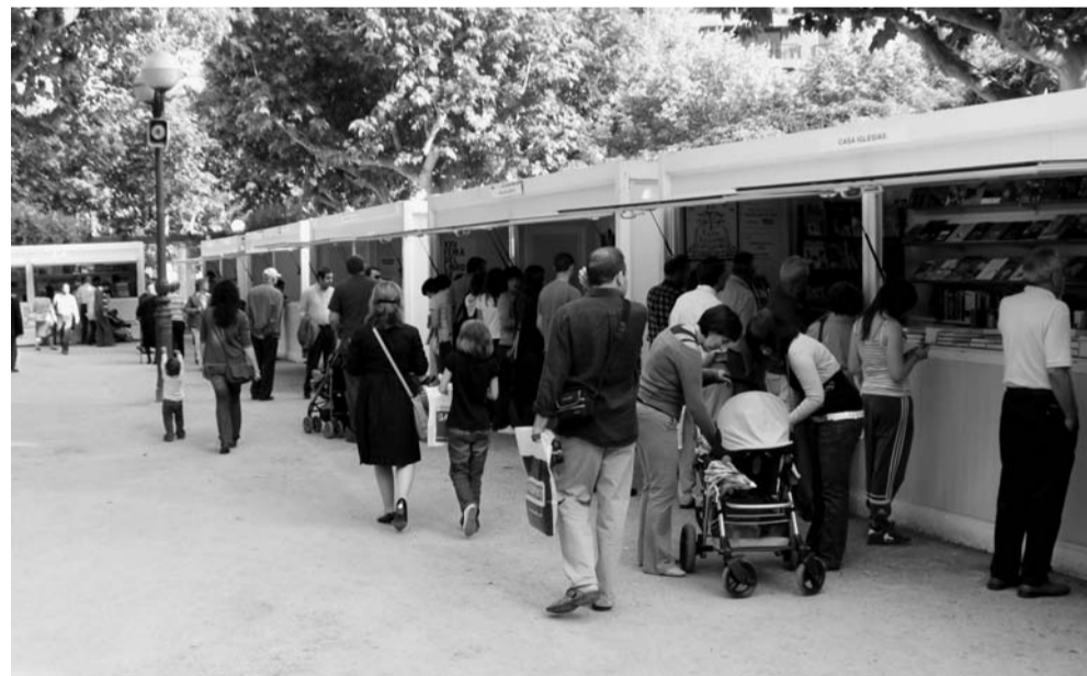
Casetas de la Feria del Libro de Huesca, situadas en el Parque Miguel Servet. 2008.

un gran debate sobre cómo afectan las TIC a la industria del libro, un debate que gira en torno al futuro del libro y sus nuevos formatos y del que no es ajeno el Centro del Libro de Aragón. Su web, así como la revista que edita semestralmente, Letras Aragonesas , se han convertido ya en un referente en el sector profesional del libro.