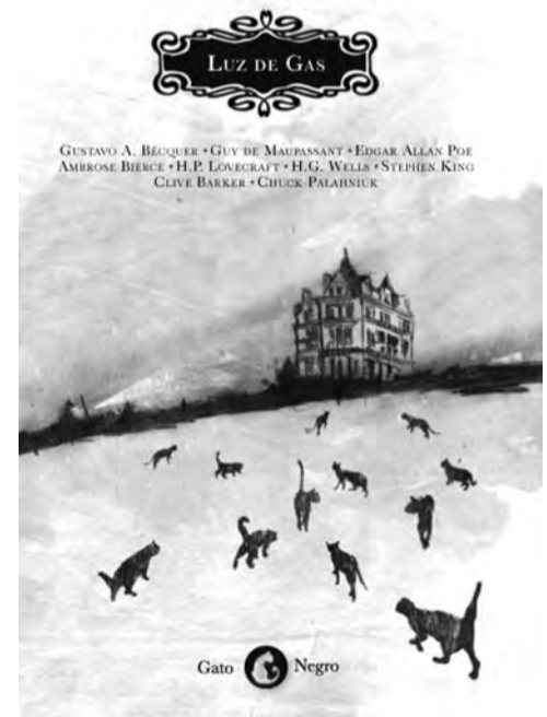
Cubierta de Luz de Gas , título publicado por el colectivo Gato Negro en 2009.

El cómic aragonés está de enhorabuena. En el V Salón Internacional del Cómic de Málaga el turolense Luis Royo fue premiado por su aportación a la fantasía épica en el mundo del cómic, y los zaragozanos Fernando Monzón y Enrique Mendoza fueron reconocidos como autores revelación 2009 por su obra Agustina (1001 Ediciones. Zaragoza). Y llega la 28 edición del Salón del Cómic de Barcelona donde la gran triunfadora fue la novela gráfica El arte de volar (Edicions del Ponent. Alicante), una obra que ya había recibido el Premio Nacional del Cómic de Cataluña. Esta publicación, con guión del zaragozano Antonio Altarriba e ilustraciones de Kim, dibujante conocido por su personaje de Martínez el facha de la revista El Jueves , recibe también el premio al mejor guión y a la mejor ilustración convirtiéndola en la gran triunfadora del salón.