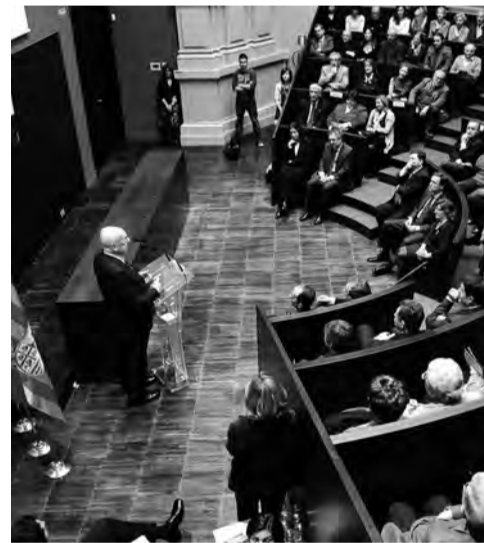
Distintos momentos del día de entrega del Premio de las Letras Aragonesas.

El Jurado acordó otorgar el Premio de las Letras Aragonesas 2009 a José Luis Borau, por "su compromiso intelectual con el lenguaje cinematográfico, su lucha por la renovación de la narrativa audiovisual; y por la asunción del valor literario de la escritura cinematográfica y por su admirable trabajo en el campo de la cuentística, con títulos fundamentales como Camisa de once varas ".