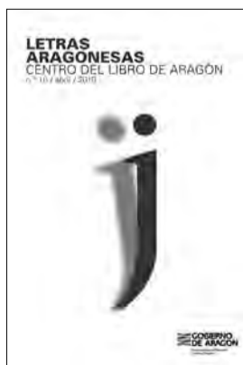
Cubierta de la última revista Letras Aragonesas .

Son ya 4.800 registros bibliográficos los que se pueden encontrar. Además, la información que en esta revista puede verse se ve ampliada en muchas ocasiones desde la plataforma on-line www.centrodelibrodearagon.es . En esta página, sumada a toda la información anterior, se puede encontrar también todo lo relativo a presentaciones de libros y actividades, que en torno al mundo editorial, se dan en la comunidad autónoma o bien fuera de ella, siempre y cuando la actividad realizada tenga relación con la misma.