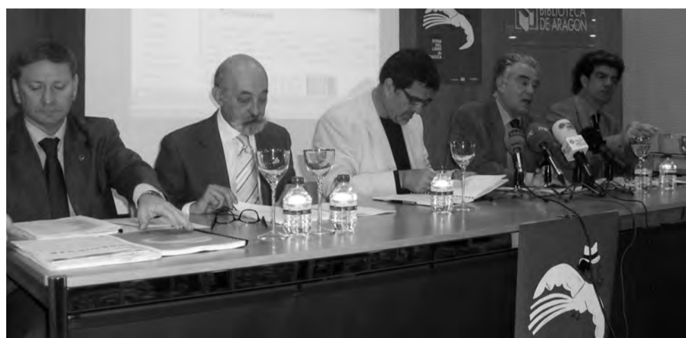
Acto de presentación de la Feria del Libro de Zaragoza en la Biblioteca de Aragón.

Las hojas de los libros pedirán permiso para ser protagonistas por unos días en el parque. Y junto a ellas, cuentacuentos, gymkhanas en busca de libros perdi-