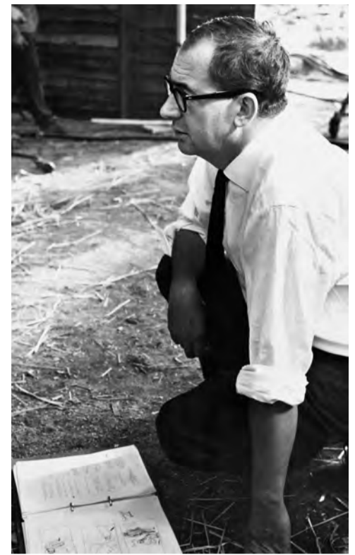
José Luis Borau en una imagen tomada durante el rodaje de Brandy , 1964.