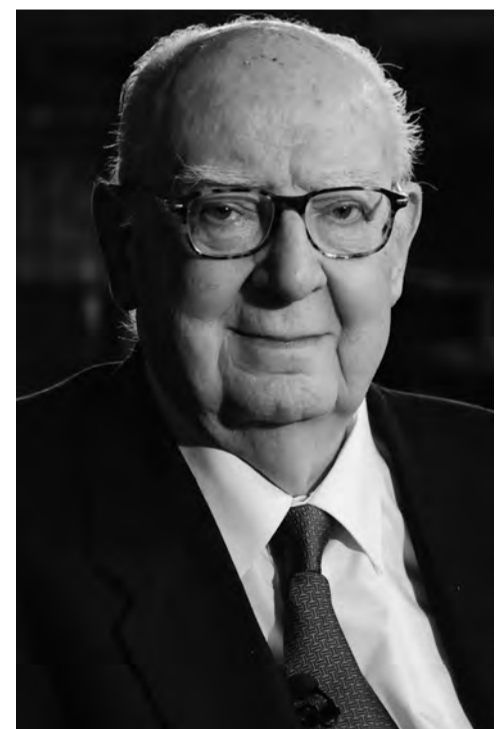
José Luis Borau el día que se le entregó el Premio de las Letras Aragonesas.

ras de Tata mía , Furtivos y Celia . Un clarinetista interpretó para sorpresa del escritor la jota que Imperio Argentina cantara también en la película Tata mía . En la antesala del Aula Magna se podía visitar una exposición que recorría la obra del director. A través de la web www.centrodellibrodearagon.es se accedía al blog de las Noches de Libros Abiertos 2010 , en donde se podía disfrutar de toda esta información y en el que todavía hoy se pueden ver diferentes vídeos del acto.