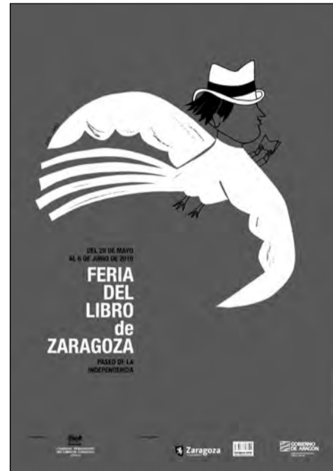
Cartel de la Feria de Zaragoza realizado por Ana Lóbez.