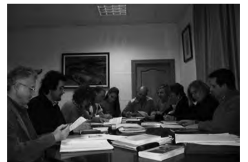
Componentes del grupo de trabajo ganador del premio Arnal Caveró en aragonés.

sión en el título Eugene Pickering de Henry James, realizado por la joven editorial Contraseña "por su cuidada tipografía,