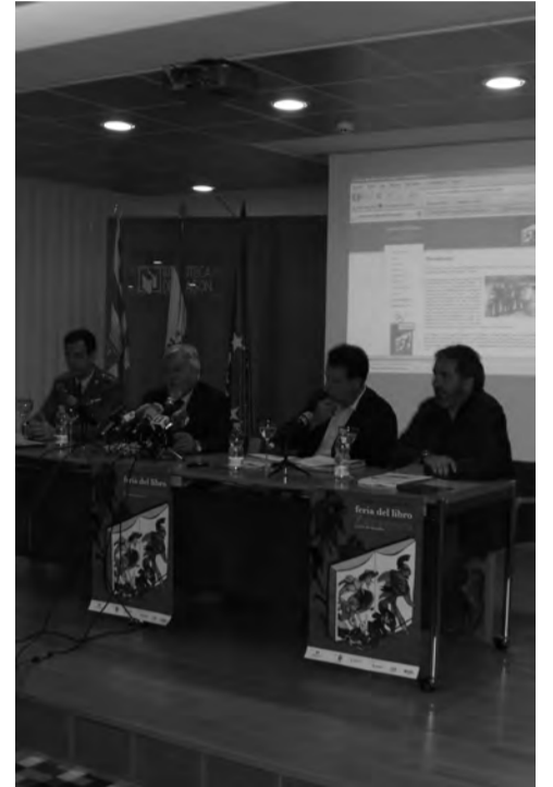
Acto de presentación de la Feria del Libro de Zaragoza en la Biblioteca de Aragón.

PROGRAMACIÓN DE LAS FERIAS DE HUESCA Y ZARAGOZA EN PÁGINAS CENTRALES