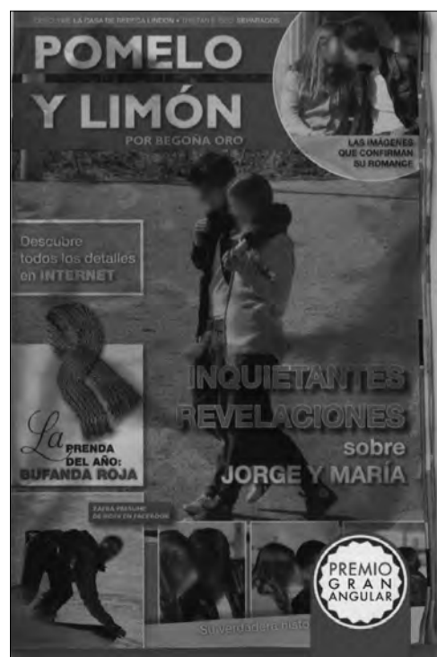
Cubierta de Pomelo y Limón .