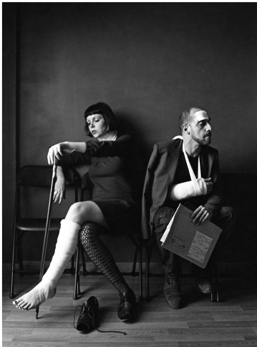
Jekyll & Jill.

A los dos nos gusta mucho lo analógico, en fotografía, cine, audio, impresión, etc., así que resulta comprensible que nos interesen las tintas, el papel, la encuadernación, todo lo que hace que